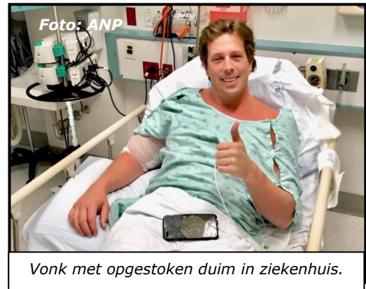
Vonk met opgestoken duim in ziekenhuis.

Aai nooit een haai. Daar is Freek Vonk, Nederlands bekendste bioloog ook achter gekomen. Hij werd onlangs op het eilandje Bimini in zijn rechterarm gebeten door een Caribische rifhaai. Inmiddels gaat het beter met Vonk, al heeft hij wel zo'n honderd hechtingen in zijn arm en is de huid in zijn onderarm nog niet hersteld. Hij blijft optimistisch: 'Ik hoop jullie allemaal binnenkort weer met mijn rechterarm een grote 'haai five' te kunnen geven.'